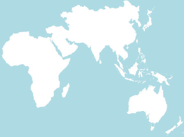
Asia y Resto del Mundo