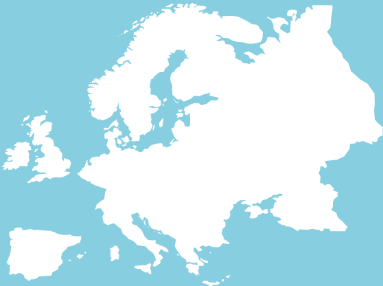
Europa (Francia no incluida)